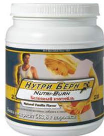
1 мерные ложки Nutri Burn