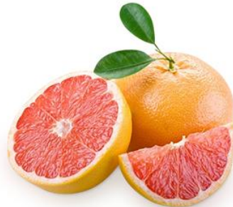
200 мл. грейпфрутового сока