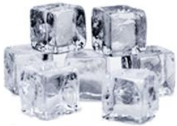
3 - 4 кусочка льда