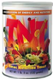
1 мерные ложки TNT